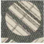
L5027_GRAND _TOKYO_NEGA TIF_N3137_FE