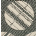
L5027_GRAND _TOKYO_NEGA TIF_N3137_FE