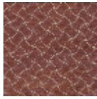
L5032_NAIADE _C517_C529_F M