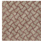
L5032_NAIADE _C517_C529_F M_VERSO