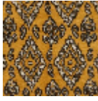
L5036_MINOR QUE_C515_C50 8_FE