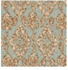
L5036_MINOR QUE_B30_B28 _FE