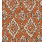
L5036_MINOR QUE_N3013_N 3002_FE