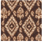
L5036_MINOR QUE_B72_B57 _FE