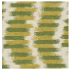
L5037_DUCHE SSE_B23_B76_ FE