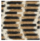
L5037_DUCHE SSE_C508_C51 3_FE