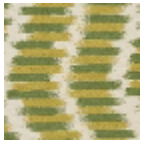
L5037_DUCHE SSE_B23_B76_ FE