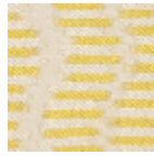
L5037_DUCHE SSE_N3006_N 3010_FE