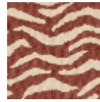
L5038_BENGA LE_N3179_FE_ VERSO