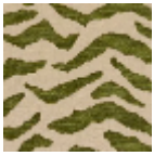
L5038_BENGA LE_C539_C541_ FG