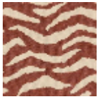
L5038_BENGA LE_N3179_FE_ VERSO