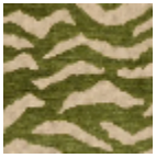
L5038_BENGA LE_C539_C541_ FG_VERSO