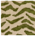
L5038_BENGA LE_C539_C541_ FG