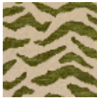
L5038_BENGA LE_C539_C541_ FG