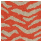
L5038_BENGA LE_B92_FM_V erso