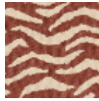
L5038_BENGA LE_N3179_FE_ VERSO