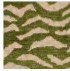
L5038_BENGA LE_C539_C541_ FG_VERSO