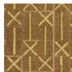
L5039_MAREL LE_N3017_N30 21_FB