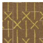
L5039_MAREL LE_B76_B46_F E