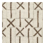
L5039_MAREL LE_C511_N3006 _FM