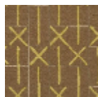
L5039_MAREL LE_B76_B46_F E