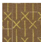
L5039_MAREL LE_B76_B46_F E