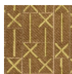
L5039_MAREL LE_N3017_N30 21_FB