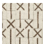
L5039_MAREL LE_C511_N3006 _FM