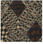
L5042_DJIBOU TI_C508_B67_ C509_FI