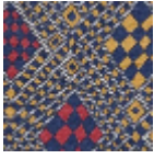
L5042_DJIBOU TI_C531_B58_B O2_FE