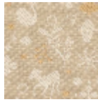
L5046_BRIDG E_N3004_N30 06_FC