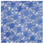
L5048_TOURB ILLONS_C532_ FE