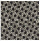
L5048_TOURB ILLONS_B54_F E