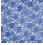
L5048_TOURB ILLONS_C532_ FE