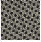
L5048_TOURB ILLONS_B54_F E