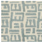
L5049_TSOMB A_N3016_FE_V erso