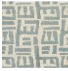
L5049_TSOMB A_N3016_FE_V erso