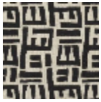
L5049_TSOMB A_B54_FE_Ver so