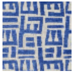
L5049_TSOMB A_C532_FE_Ve rso