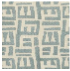
L5049_TSOMB A_N3016_FE_V erso