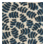
L5052_GNOCC HI_C508_C533 _FE