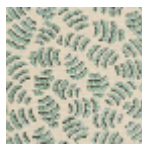
L5052_GNOCC HI_N3137_N313 5_FE