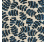
L5052_GNOCC HI_C508_C533 _FE