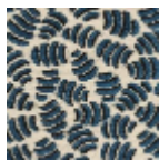
L5052_GNOCC HI_C508_C533 _FE