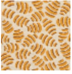
L5052_GNOCC HI_B28_B58_F E