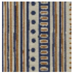
L5053_COCHI NE_B28_B38_F M