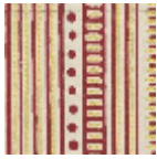
L5053_COCHI NE_N3010_B8 4_FE