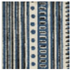
L5053_COCHI NE_C508_C533 _FE