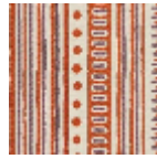
L5053_COCHI NE_N3012_N30 15_FE