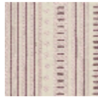
L5053_COCHI NE_N3012_N30 08_FE