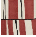
L5056_ZEPPEL IN_C521_C508_ FE