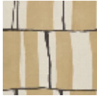
L5056_ZEPPEL IN_N3004_N30 O2_FE