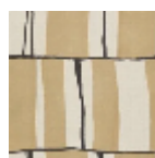
L5056_ZEPPEL IN_N3004_N30 O2_FE