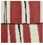
L5056_ZEPPEL IN_C521_C508_ FE