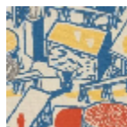
L5062_PETIT_A TELIER_B21_B9 2_B32_B71_FE