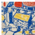
L5062_PETIT_A TELIER_N3019_ N3015_N3010_ N3003_FE