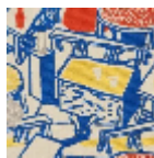
L5062_PETIT_A TELIER_N3019_ N3015_N3010_ N3003_FE