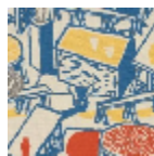
L5062_PETIT_A TELIER_B21_B9 2_B32_B71_FE