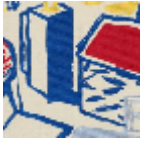
L5063_GRAND _ATELIER_N30 19_N3014_N301 O_N3002_FE