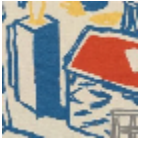
L5063_GRAND _ATELIER_B21_ B92_B32_B71_ FE