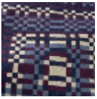
L5064_RADIO STAR_B38_B14 _B42_FE