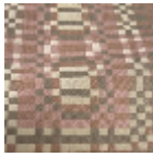
L5064_RADIO STAR_N3003_ N3022_N3008_ FE