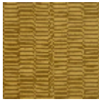
L5067_KATHM ANDU_C515_C 512