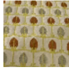
L5070_MENNA _B76_N3013_N 3023_FC