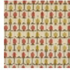
L5070_MENNA _N3021_N3139_ N3104_FE