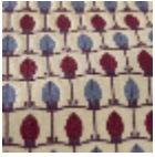
L5070_MENNA _B14_B42_B13_ _FE