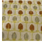
L5070_MENNA _B76_N3013_N 3023_FC