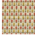
L5070_MENNA _N3021_N3139_ N3104_FE