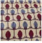
L5070_MENNA _B14_B42_B13_ _FE