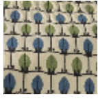
L5070_MENNA _B54_B23_B21_ _FE