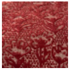
L5071_FLEUR_ DE_COTON_C5 20_FE