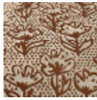
L5071_FLEUR_ DE_COTON_N 3179_FE