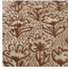
L5071_FLEUR_ DE_COTON_N 3179_FE