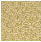
L5071_FLEUR_ DE_COTON_N 3010_N3004_F E