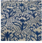
L5071_FLEUR_ DE_COTON_N 3019_FE