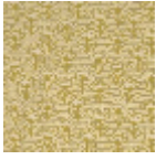
L5071_FLEUR_ DE_COTON_N 3010_N3004_F E