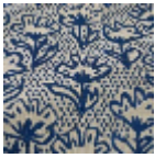
L5071_FLEUR_ DE_COTON_N 3019_FE