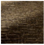
L5072_VOLUT ES_C508_C512_ FB