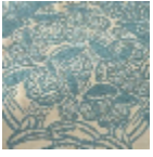
L5076_DRAPE RIES_B73_B37 _FE