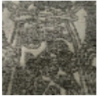
L5076_DRAPE RIES_C544_C5 08_FM