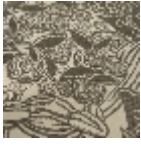
L5076_DRAPE RIES_N3023_N 3002_FE