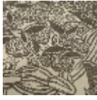
L5076_DRAPE RIES_N3023_N 3002_FE