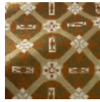
L5077_CASTEL NAU_N3004_N 3021_N3013_FE