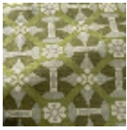
L5077_CASTEL NAU_C539_C5 42_C544_FE