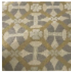
L5077_CASTEL NAU_N3004_N 3003_N3006_F G