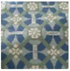
L5077_CASTEL NAU_B31_B21_ B30_FE