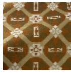
L5077_CASTEL NAU_N3004_N 3021_N3013_FE