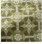
L5077_CASTEL NAU_C539_C5 42_C544_FE