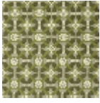
L5077_CASTEL NAU_C539_C5 42_C544_FE