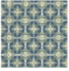
L5077_CASTEL NAU_B31_B21_ B30_FE