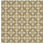
L5077_CASTEL NAU_N3004_N 3003_N3006_F G