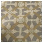
L5077_CASTEL NAU_N3004_N 3003_N3006_F G