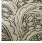
L5078_LES_DA TTES_N3023_N 3002_FE