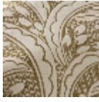
L5078_LES_DA TTES_N3004_ N3021_FE