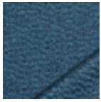
O7939001 Grand large