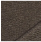
O7939021 Sous bois