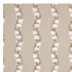
T0086002 Gnton border chanterelle