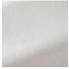
TS018 OFF WHITE